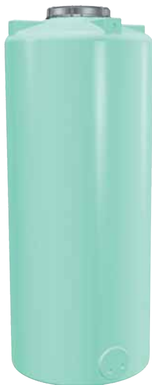
SV e HSV serbatoio verticale SLENDER

⊗ non previsti ● di serie ⊕ predisposto alla foratura ○ raccordi disponibili a richiesta: - in ottone da 2" o 1"1/4 (maschio) - in plastica da 2" (maschio) ⚙ dispositivo di sfiato 1" ■ raccordo per sfiato 2" maschio