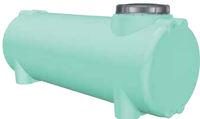
CO cisterna orizzontale SLIM